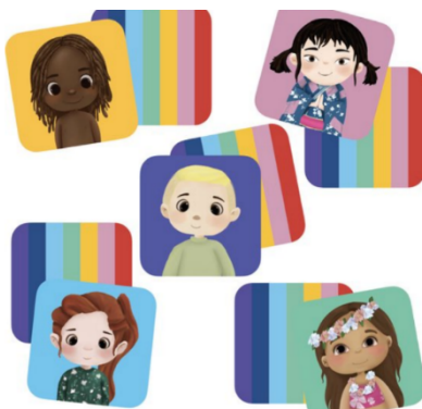
Hé, wie ben jij? spel | Hét kleurrijke spel vol diversiteit

Met deze magnetische sets kunnen de kinderen vrolijke mensjes met verschillende huidskleuren aankleden en mooi maken.