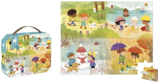
Puzzel van de seizoenen

Bij het aanschaffen van speelgoed of leermateriaal is het belangrijk om te letten op de representatie van diversiteit. Hierdoor wordt het vanzelfsprekend voor kinderen om te zien dat er kinderen zijn uit verschillende culturen en met diverse uiterlijke kenmerken en dat gezinsvormen er ook op vele manieren zijn.