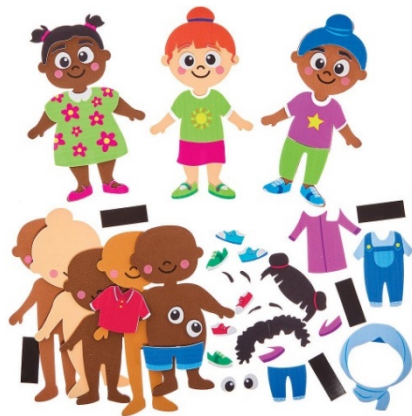
Diversiteit Mix & Match Magneet Sets

Met deze magnetische sets kunnen de kinderen vrolijke mensjes met verschillende huidskleuren aankleden en mooi maken.