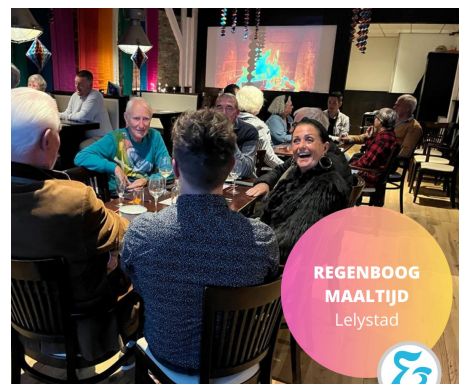
Spot (ABC Gebouw) - Neringpassage, Lelystad 27 oktober 17:30 - 20:00 uur

De regenboogmaaltijden vinden elke laatste vrijdag van de maand plaats bij lunchroom Le Passage. Nu er in 2023