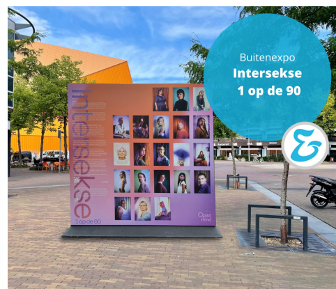
Agorahof 31 augustus tot 20 september

Van 30 augustus tot 20 september is expositie 'Intersekse – 1 op de 90' te zien op het Agorahof. Via levensgrote portretten en persoonlijke verhalen worden bezoekers meegenomen in de grote diversiteit die er bestaat binnen intersekse condities. In de drie weken dat de expositie is te zien wordt deze tot twee keer toe vernield. Duidelijk is dat het een onderwerp is dat veel vragen oproept en