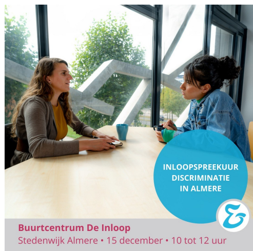
Buurtcentrum De Inloop Stedenwijk Almere • 15 december • 10 tot 12 uur

Op initiatief van Tumba hebben de ADV's in 2020 de mensenrechtenvlag geïntroduceerd om te benadrukken hoe belangrijk mensenrechten zijn. Deze vlag is een